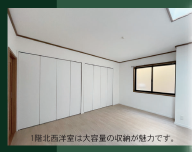
1階北西洋室は大容量の収納が魅力です。