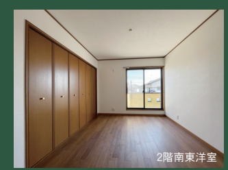
大型のクローゼットを 完備した2階南東洋室

南東から明るい光が差し込む陽だまり空間。 明るい開放感のあるリビングダイニングは、 約15.3帖のゆとりのスペースがございます。