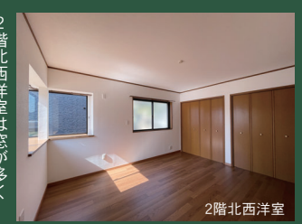
2階北西洋室は窓が多く 北西側特有の暗さは 感じません。 収納も充実しております。