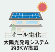
オール電化 太陽光発電システム 約3KW搭載