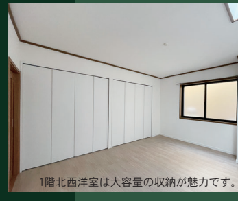
1階北西洋室は大容量の収納が魅力です。