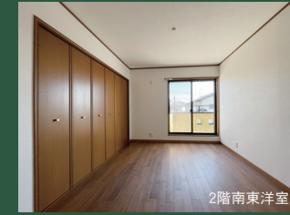
大型のクローゼットを 完備した2階南東洋室